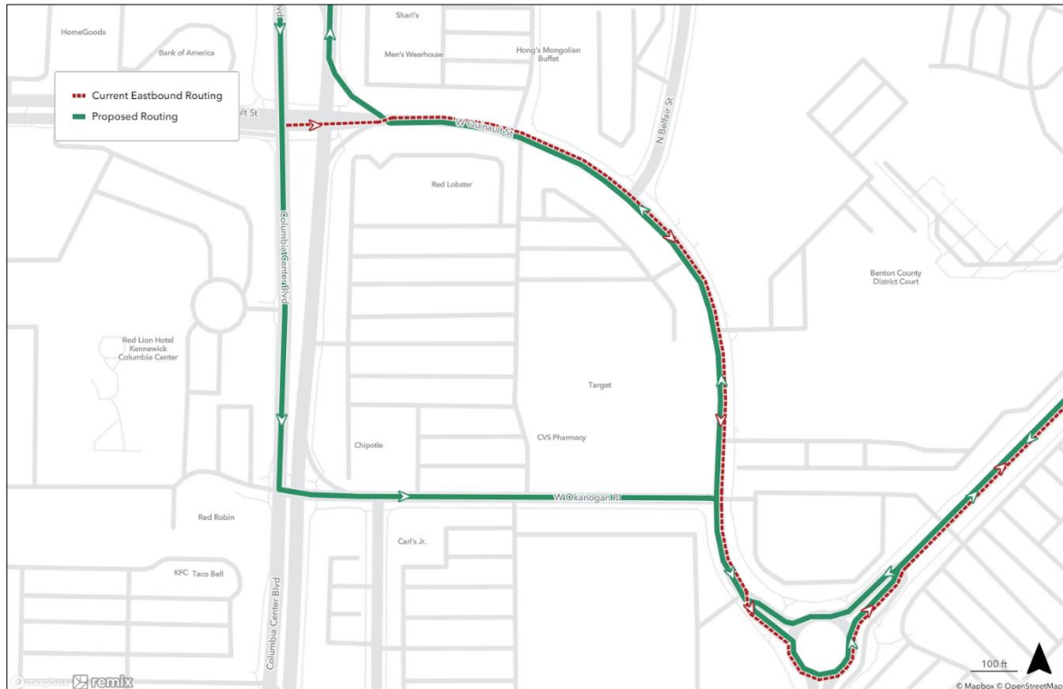
Figura 1 - Realineamiento Para La Ruta 1 Del METRO

*Frecuencia y vehículos después de las 8 PM